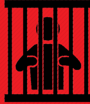
زندانی‌های آزاد شده در «یک شهر ضیافت»